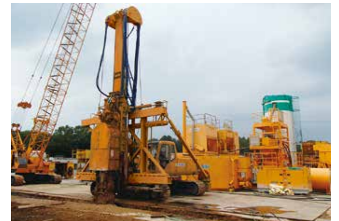
小型等厚式施工機での施工状況