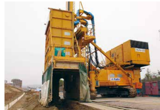
大型等厚式施工機での施工状況